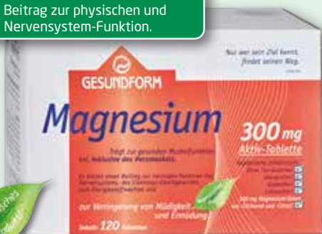
Gesundform Magnesium 300 mg 120 Aktiv-Tabletten