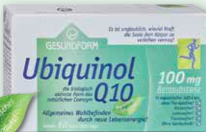
Gesundform Ubiquinol Q10 100 mg 60 Vega-Soft-Caps, statt € 65,99 1)