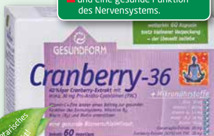
Gesundform Cranberry-36 60 Vega-Caps