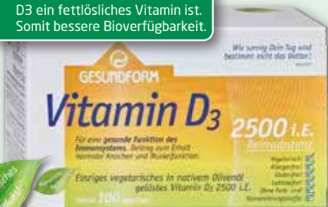
Gesundform Vitamin D 3 2500 i.E. 100 Vega-Caps