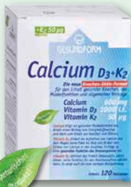
Gesundform Calcium D3+K2 120 Tabletten