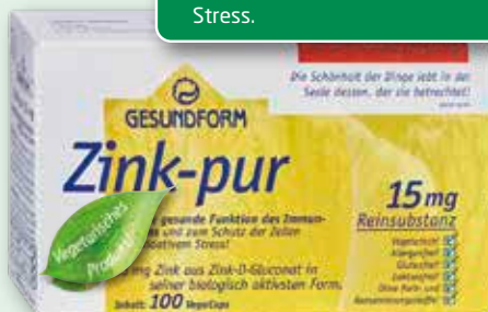
Gesundform Zink-pur 15 mg 100 Vega-Caps statt € 15,99 1)